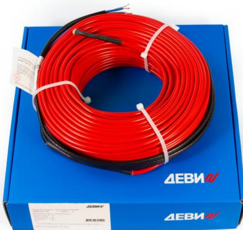
Рис. 1. Внешний вид нагревательного кабеля ДЕВИ Flex-18Т.