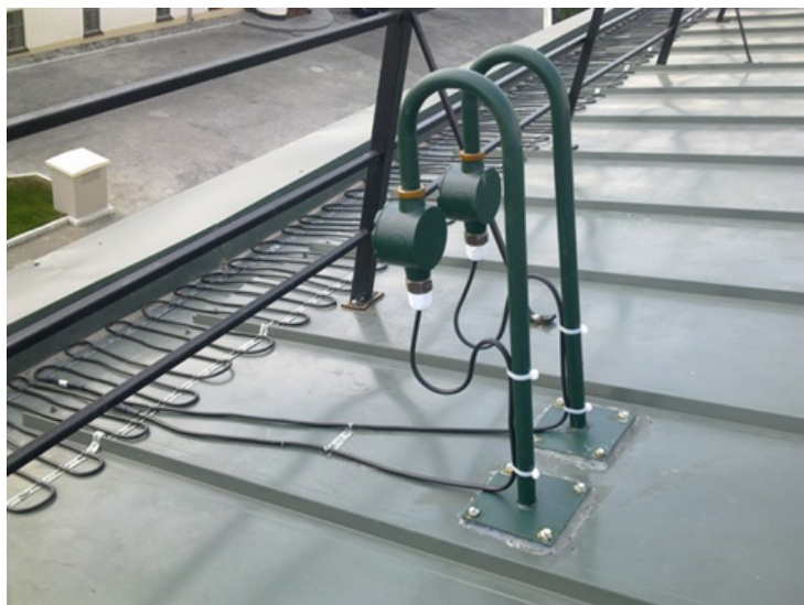
Рис. 3. Монтаж нагревательного кабеля на крыше. ДЕВИ Snow-30Т

В некоторых случаях использования нагревательных кабелей, например, при монтаже в водосточных желобах и трубах, с целью предотвращения замерзания талой воды, определяющим параметром может быть длина нагревательной секции. При выборе нагревательных кабелей необходимо учитывать допустимый разброс параметров, приведенных в технических характеристиках, и возможные отклонения напряжения питающей сети.