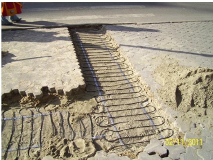
Рис. 4. Монтаж нагревательного кабеля ДЕВИ Snow-30Т для обогрева пешеходной зоны.