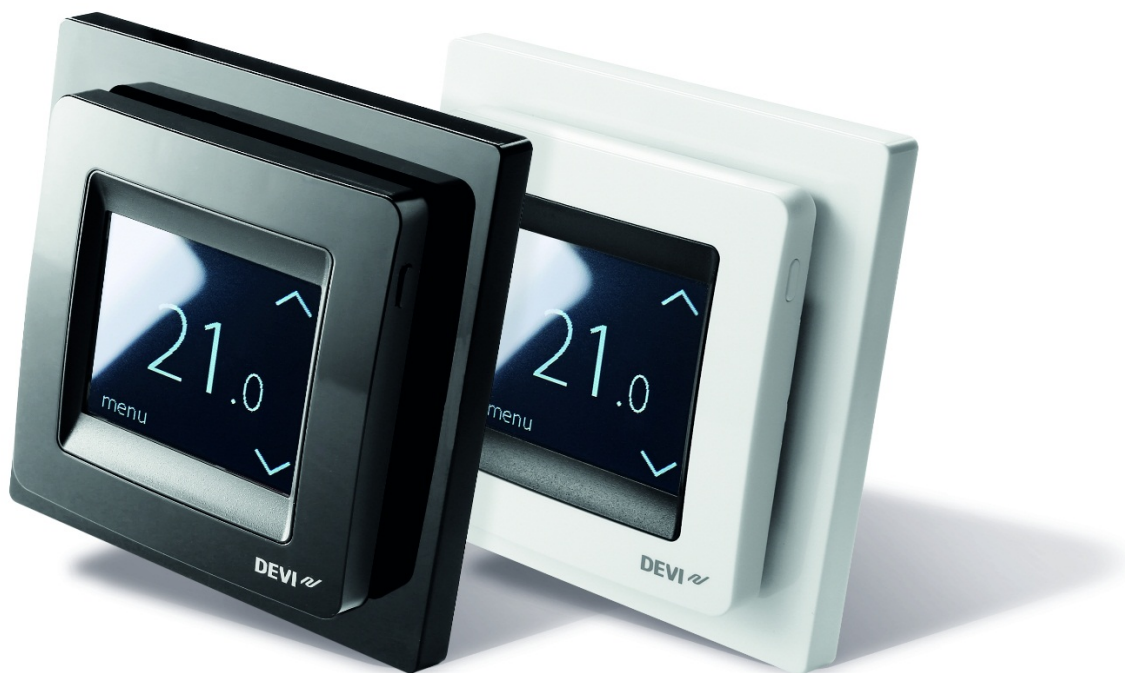
Рис. 1. Терморегулятор электронный с таймером DEVIreg™ Touch.

Терморегулятор поставляется в виде готового электронного блока для установки в стенную монтажную коробку с крепежной базой 60 мм, аналогично электрическому коммутационному оборудованию для скрытой проводки.