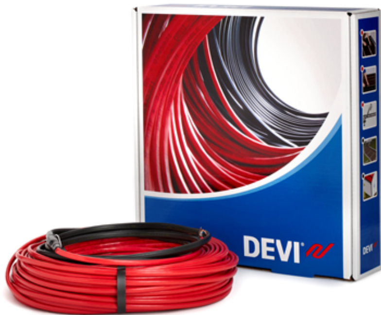
Рис. 1. Внешний вид нагревательного кабеля DEVIflex™ 18T с упаковочной коробкой.