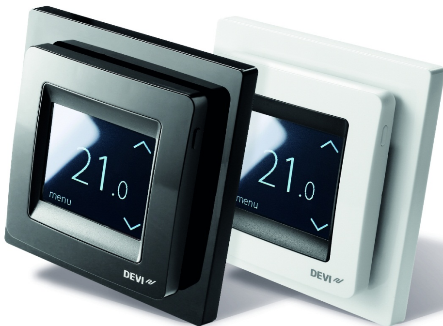
Рис. 1. Терморегулятор электронный с таймером DEVIreg™ Touch.

Терморегулятор поставляется в виде готового электронного блока для установки в стенную монтажную коробку с крепежной базой 60 мм, аналогично электрическому коммутационному оборудованию для скрытой проводки.