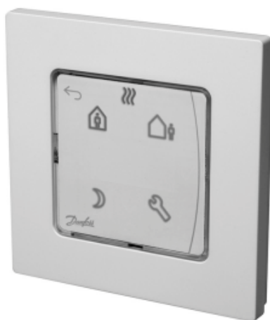
Danfoss Icon™ Programmable

Комнатный термостат типа Icon™ Programmable применяется для управления системой водяных теплых полов. Обеспечивает регулирование комнатной температуры в соответствии с потребностями пользователя, энергосбережение и комфорт.