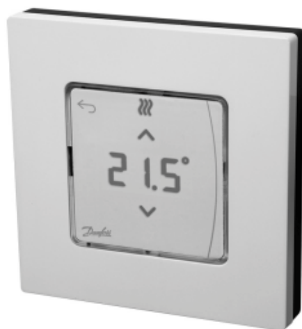
Danfoss Icon™ Display

Комнатный термостат типа Icon™ Display применяется для управления системой водяных теплых полов. Обеспечивает регулирование комнатной температуры в соответствии с потребностями пользователя, энергосбережение и комфорт.